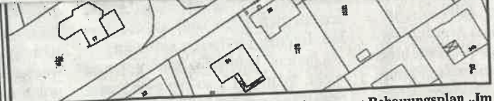
Mit dieser Bekanntmachung tritt der Vorhabenbezogener Bebauungsplan „Im Münsterfeld“ in Kraft.

Gemäß § 44 Abs. 4 erlischt ein Entschädigungsanspruch, wenn nicht innerhalb von 3 Jahren, nach Ablauf des Kalenderjahres, in dem die in §§ 39 bis 42 BauGB bezeichneten Vermögensnachteile eingetreten sind, die Fälligkeit des