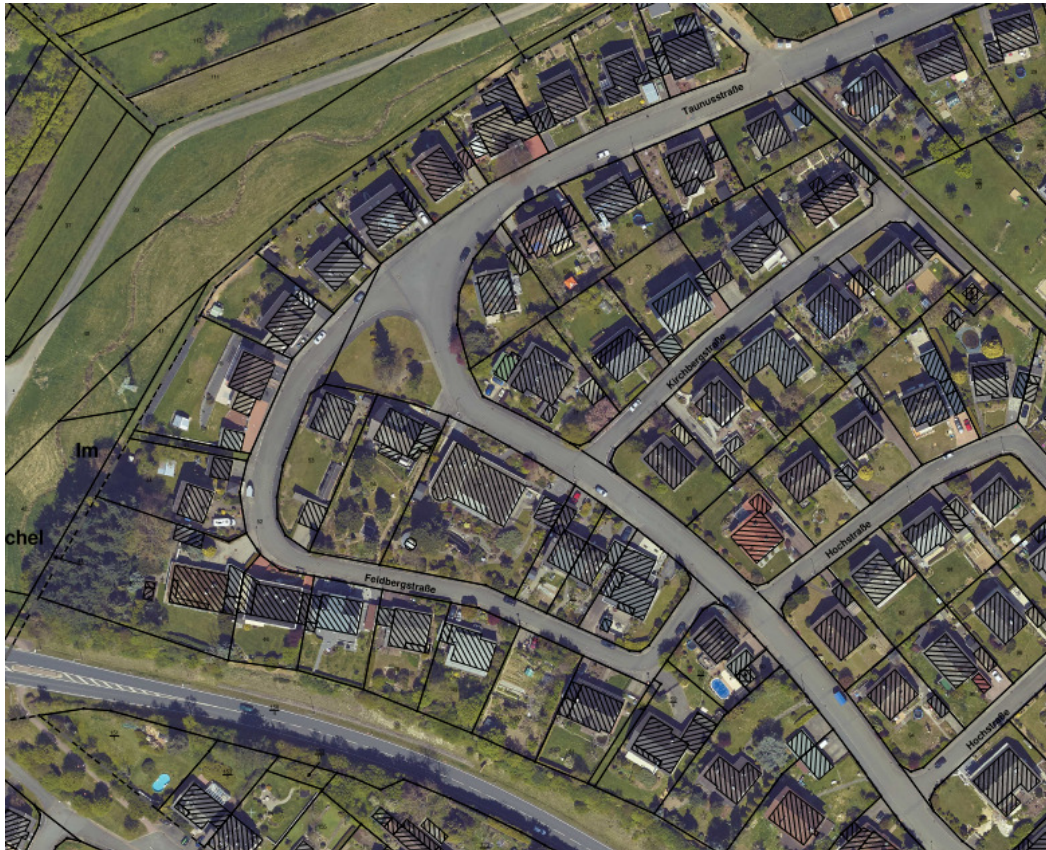
Abb. 1: Luftbild Übersicht, ohne Maßstab