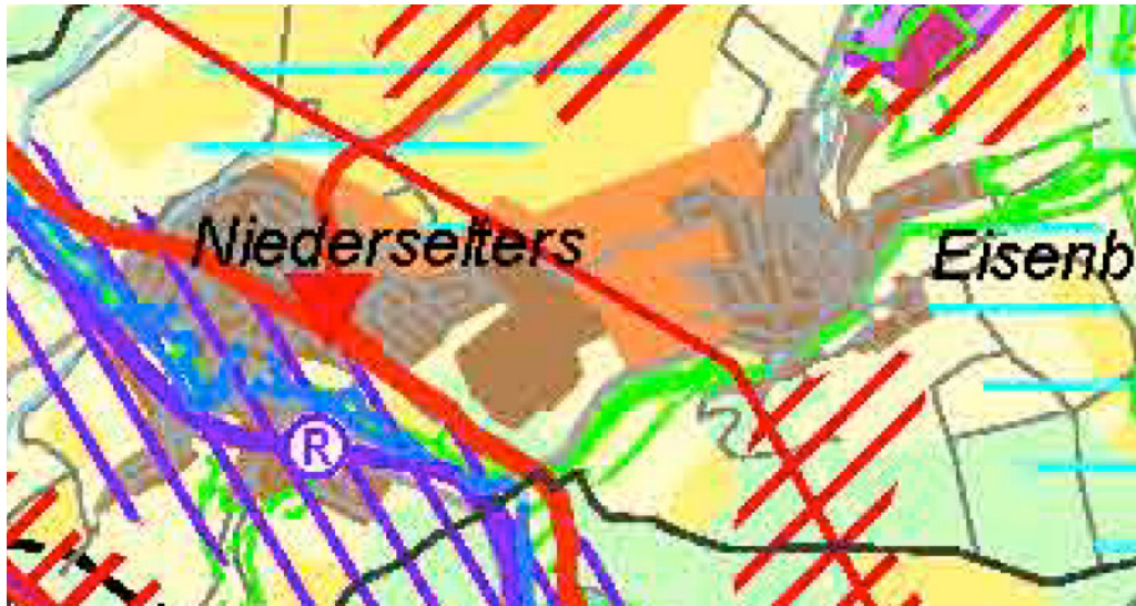
Abb. 3: Auszug aus dem Regionalplan Mittelhessen 2010 (ohne Maßstab)