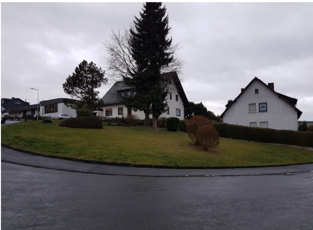
Abb. 4: Ansicht der Fläche von Norden her, 17.01.2019

Die verkehrliche Erschließung ist bereits vorhanden und erfolgt über das vorhandene Straßennetz von Niederselters und darüber an die B 8, die erforderlichen Stellplätze sind, entsprechend der Stellplatzsatzung der Gemeinde Selters, nachzuweisen. Ein Ausbau vorhandener Verkehrsfläche wird nicht erforderlich.