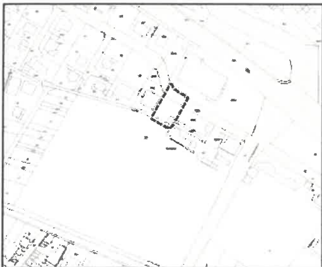
Selters (Taunus) den 01.12.2021