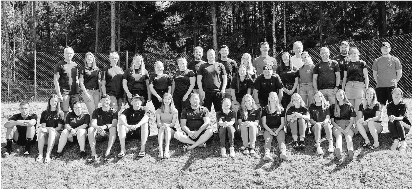
Das Betreuersteam freut sich schon auf euch!

Der TV Niederselters bietet Kids im Alter von 8-14 Jahren in den hessischen Sommerferien ein abwechslungsreiches Programm mit viel Spaß und Action. Auch Nicht-Vereinsmitglieder sind herzlich willkommen! In diesem Jahr wird das Event von Montag, 25. bis Samstag 30. Juli 2022 in Haintchen stattfinden. Falls gesundheitliche Vorgaben eine Durchführung verhindern sollten bzw. die geforderten Maßnahmen für uns nicht realisierbar sind, behält sich der TV Niederselters vor, das Zeltlager abzusagen und die Kosten für die angemeldeten Kinder zu erstatten.