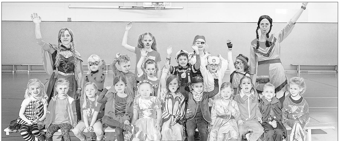
Toll kostümiert verbrachten die Jüngsten der LSG ihre Trainingsstunde an Rosenmontag mit Tanz und Spiel.