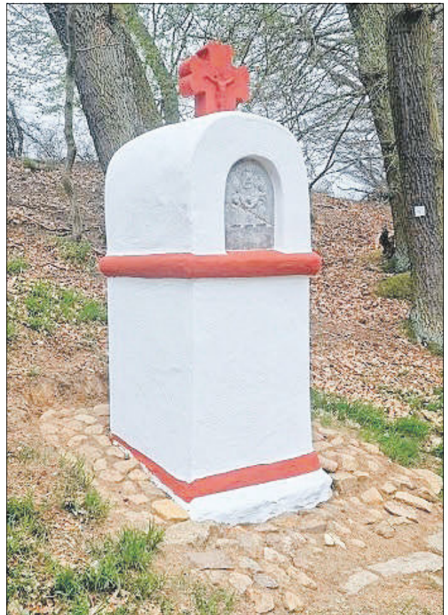
Der fertig renovierte Bildstock