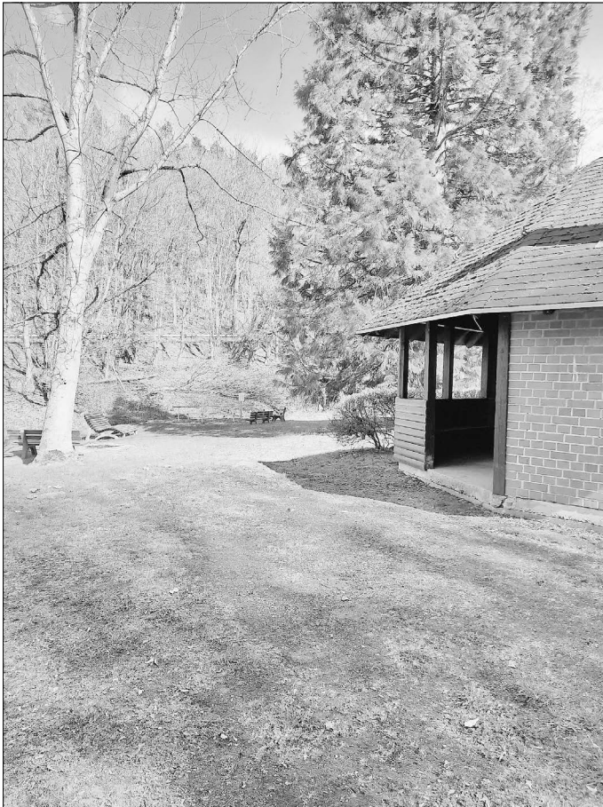
Grillhütte und Wassertretstelle - Haintchen

Der nächste Arbeitseinsatz ist für 18. Mai um 17:30 Uhr geplant. Treffpunkt ist das Lager, im Lerchenweg.