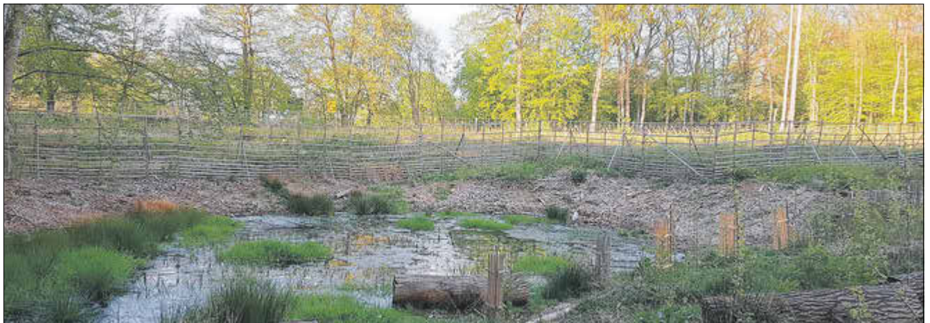
Unmittelbar an der Freifläche in Abteilung 316 grenzt ein kleines Biotop. Zahlreichen Lebewesen wird hier ein kleines Domizil geboten.

Für den Herbst 2022 kündigt Frank Zabel eine Bürgerpflanzaktion an, die hoffentlich nach den coronabedingt ausgefallenen bisherigen Terminen, stattfinden kann.