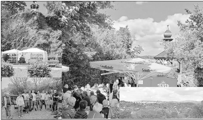
Das Bild zeigt neben dem gut besuchten Fest am Aussichtstürmchen auch die Pavillons für das Kinderfest, die schöne Aussicht und einen Teil der Mannschaft, die am Ab- und Aufbau des Türmchens beteiligt war.

Zusätzlich wurde auch ein Kinderprogramm mit Dosenwerfen, Modellieren und vielem mehr von Damen des Verschönerungsvereins und ihren Freundinnen angeboten. Rege Beteiligung belohnten die Damen für ihre Arbeit bei der Vorbereitung und der Durchführung des Kinderprogramms. Wir bedanken uns an dieser Stelle bei allen, die zum Gelingen des Festes beigetragen haben. Die gelungene Veranstaltung freute alle Beteiligten und entschädigte für die viele Arbeit der vergangenen Wochen. Der gute Verlauf, das schöne Wetter und die gute Stimmung legten nahe, ein Fest am Aussichtstürmchen vielleicht öfter durchzuführen.