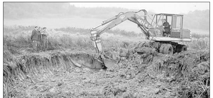
Im November 1984 wurden die ersten Teiche im Karl-Rembser-Biotop angelegt.

Wir freuen uns auf viele Helfer, die Interesse am Erhalt der Artenvielfalt haben!