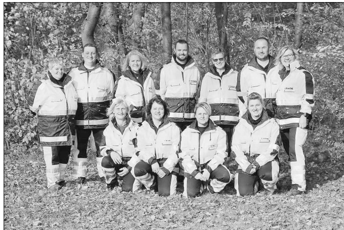
Gruppenfoto der Rettungshundestaffel Goldener Grund

https://rettungshunde-goldenergrund.de/kontakt/