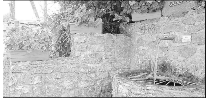
Ecker Born in Haintchen