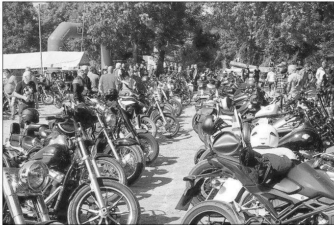
Große Resonanz beim Harley Davidson Treffen in Haintchen mit mehr als 200 Biker auf dem Waldfestplatz

Zu erwähnen bleibt auch noch das soziale Engagement der „Taunuswölfe“; schon seit vielen Jahren unterstützen sie die „Elterninitiative nierenkranken Kinder“ in Marburg – so waren auch wie in den vergangenen Jahren das Frühstück wie auch Kaffee und Kuchen für alle Teilnehmer kostenlos – und diese spendeten gerne für eine gute Sache.