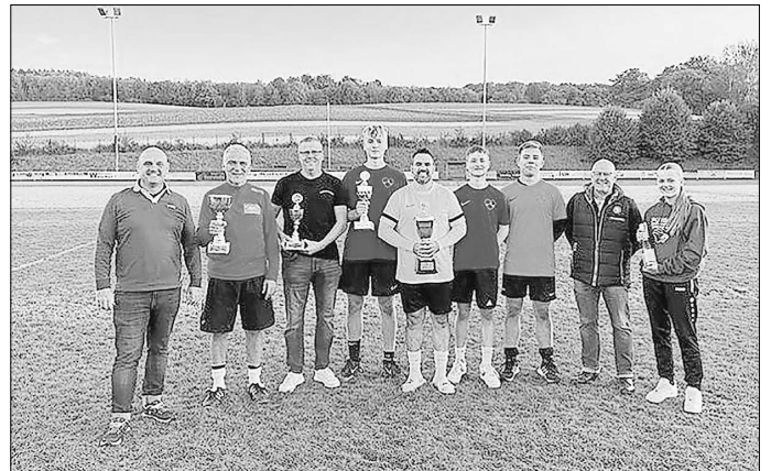
Das Bild zeigt die erfolgreichen Mannschaftsvertreter nach der Siegerehrung.