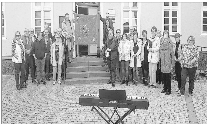
Beide Fahnen „Harmonie“ + „Bruderliebe“ hängen heute im Dorfmuseum Münster.

Am 15. 02. 1946 wurde auf Veranlassung des hiesigen Arbeitergesangsvereins Bruderliebe eine Versammlung anberaumt, welche den Zweck hatte, die beiden Gesangsvereine zu verschmelzen, um in einer wahren demokr. Gemeinschaft den Chorgesang zu pflegen. Es fanden sich auch genug Sänger zusammen, um das Vorhaben zu verwirklichen. Durch gegenseitigen Meinungs-austausch wurde dann auch eine Einigung erzielt. Man einigte sich auf den Namen „Sängervereinigung „Harmonie“ Münster.