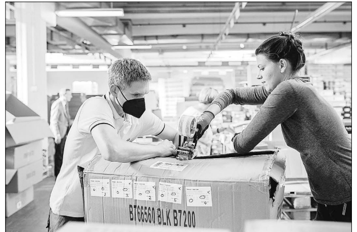
Die Winterkleidung wurde auf dem „Steinfels“ für den Weiterversand sortiert und neu verpackt.