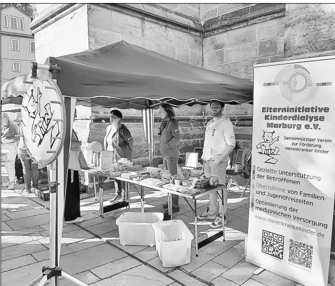
Elterninitiative Kinderdialyse Marburg e.V. auf dem Sozialmarkt an der Elisabethkirche in Marburg.