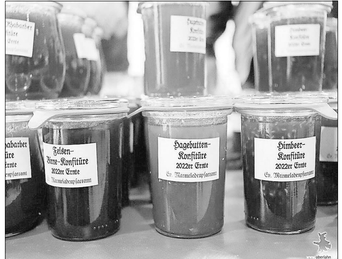
Das Foto entstand beim Martinmarkt in Weilmünster.

Und natürlich auch direkt beim Pfarramt in Münster und den bekannten „Außenstellen“ in der Region. - An allen Verkaufsstellen können auch unsere leeren Weck-Gläser wieder abgegeben werden, zum Wegwerfen oder als Staubfänger sind sie zu schade.