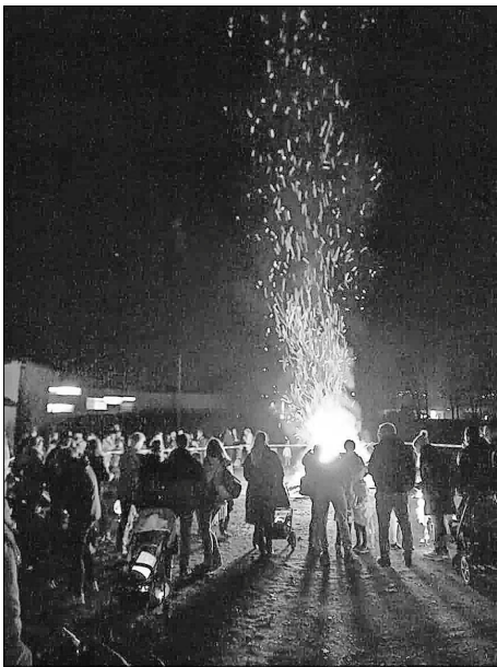
Große Freude am großen Feuer