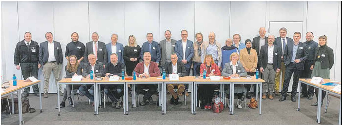
Zahlreiche Akteurinnen und Akteure trafen sich in der Adolf-Reichwein-Schule Limburg zur kommunalen Gesundheitskonferenz des Landkreises Limburg-Weilburg.