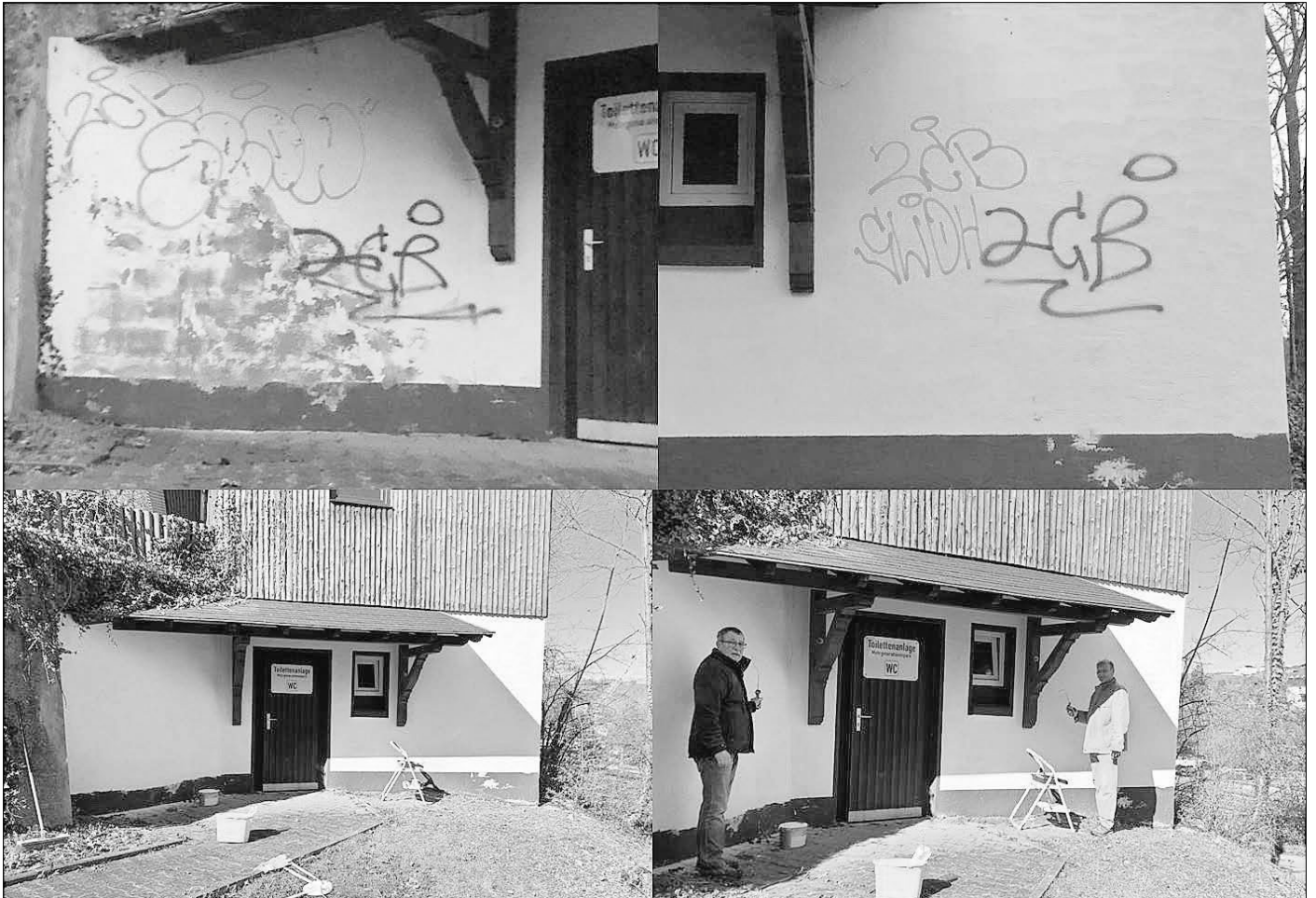
Der 1. Vorsitzende Gerald Hofmann und der 2. Vorsitzende Bernd Hartmann beim Beseitigen der Graffiti-Schmierereien

Die Toilettenanlage des Mehrgenerationenparks im Mehrzweckgebäude der Verschönerungsgemeinschaft Eisenbach ist ab sofort wieder geöffnet. Täglich von 10.00 bis 20.00 Uhr bis zum 31. Oktober 2023 steht sie den Nutzern des Mehrgenerationenparks zur Verfügung. In der Silvesternacht wurde u.a. der Eingangsbereich der öffentlichen Toilettenanlage durch Graffiti-Schmierereien stark verunreinigt, ebenso wurden Bänke, Beschilderungen und Spielgeräte beschädigt. Wir bitten die Nutzer des Mehrgenerationenparks sowie die Einwohnerinnen und Einwohner die Gemeinde bei der Bekämpfung derartiger Verhaltensweisen zu unterstützen. Hinweise bitte umgehend der Gemeindeverwaltung oder der Polizei melden.