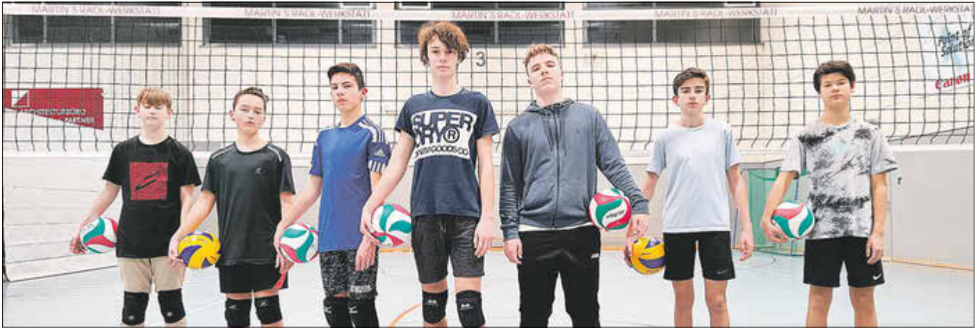
Trainingsgruppe des VC Goldener Grund

im Bürgerhaus in Oberselters statt. Alle Mitglieder sind herzlich eingeladen.