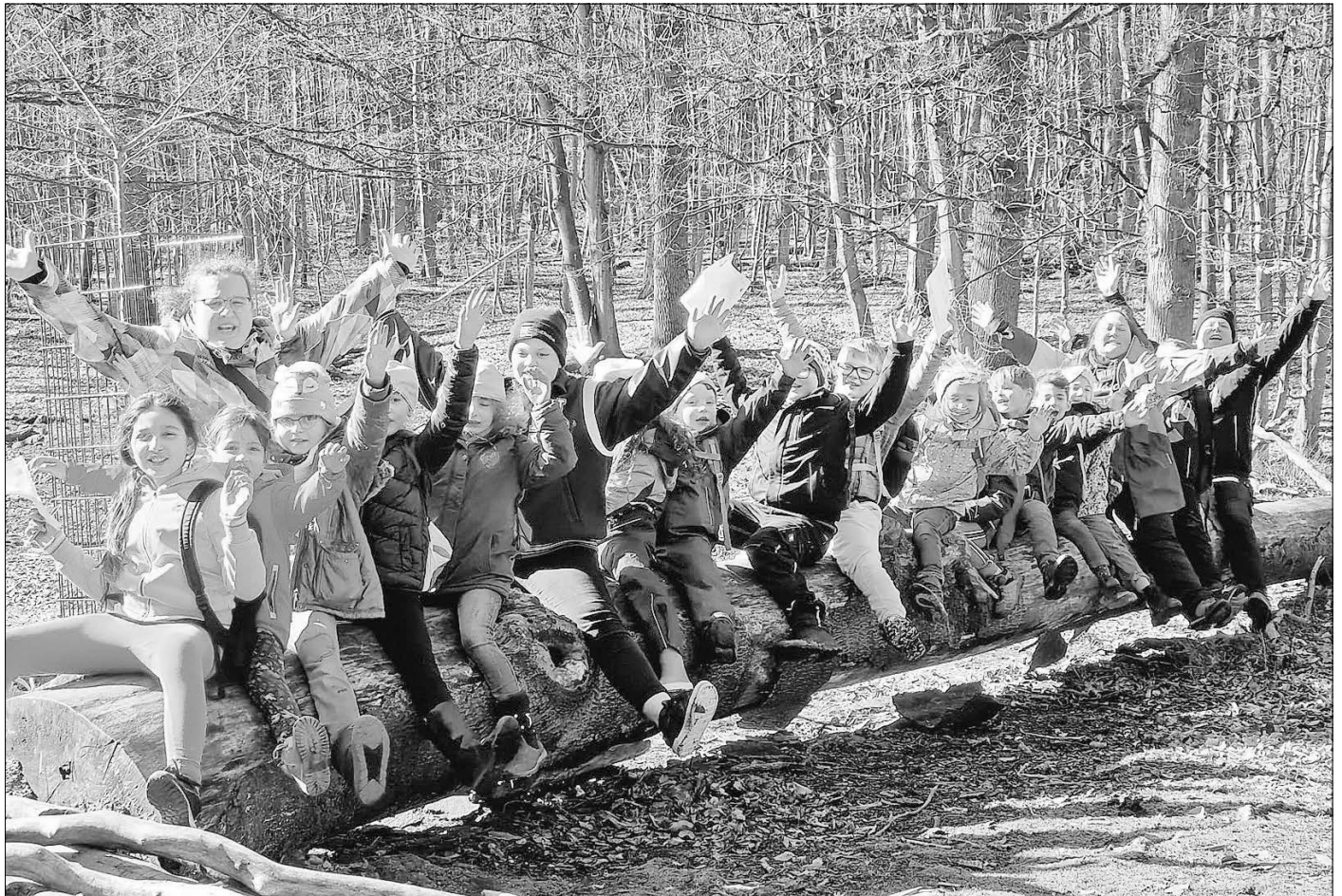
Die Löschküken und die Betreuer im Weilburger Tierpark

Am Feuerwehrhaus wurden alle Kinder glücklich, zufrieden und einige auch schlafend an ihre Eltern übergeben. Löschküken und Betreuer sind sich einig: Es war ein rundum gelungener Ausflug.