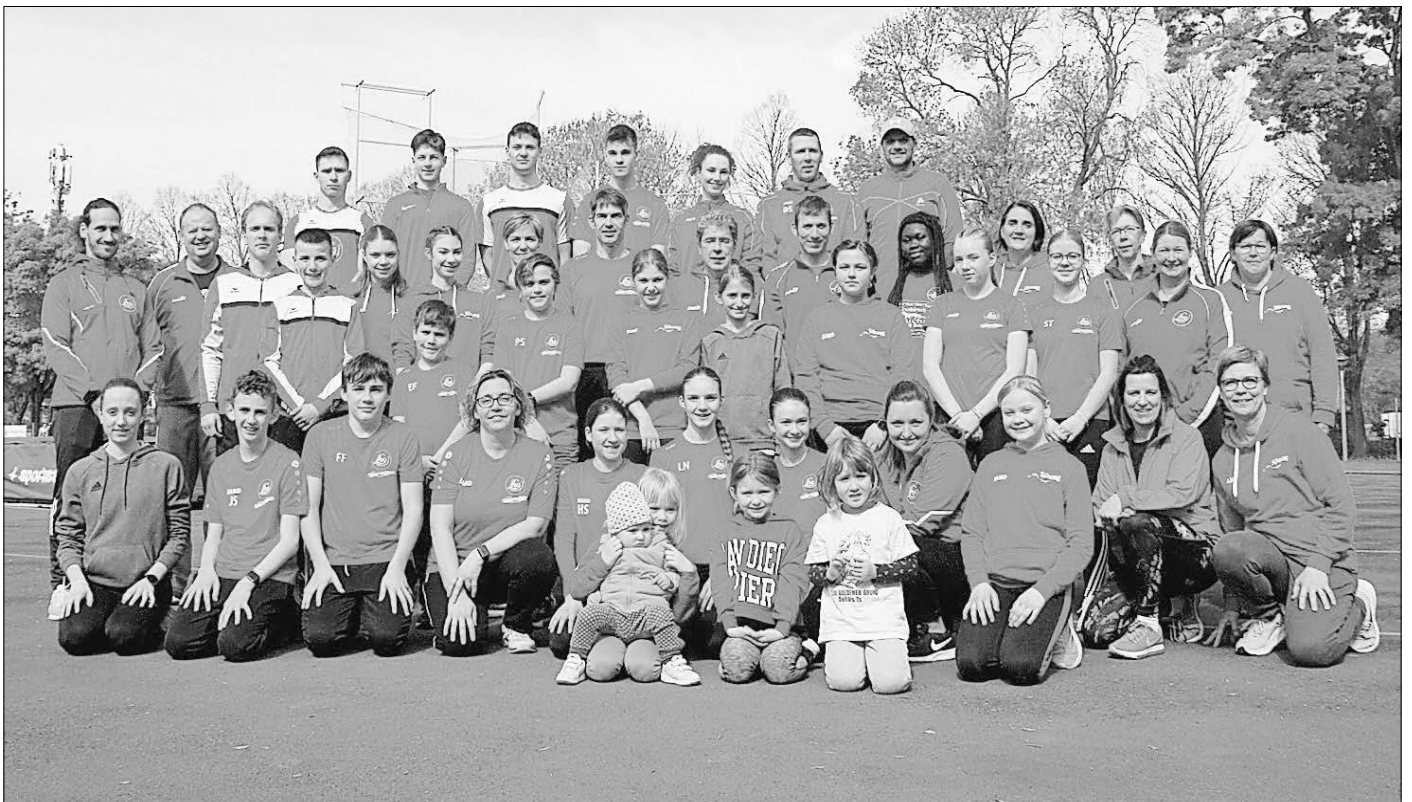
Gruppenfoto beim Trainingslager in Pesaro.

Die Breitensportler und mitgereisten Eltern taten etwas für ihre allgemeine Fitness - u. a. mit Yoga - und nutzten die Gelegenheit, bereits einige Disziplinen für das Sportabzeichen zu absolvieren. An den beiden trainingsfreien Tagen nutzte man die Gelegenheit zu Ausflügen in die nähere Umgebung (San Marino, Rimini, Perugia), Strandspaziergängen oder auch Gesellschaftsspielen. Insgesamt war es wieder ein schönes Gemeinschaftserlebnis mit toller Gruppendynamik.