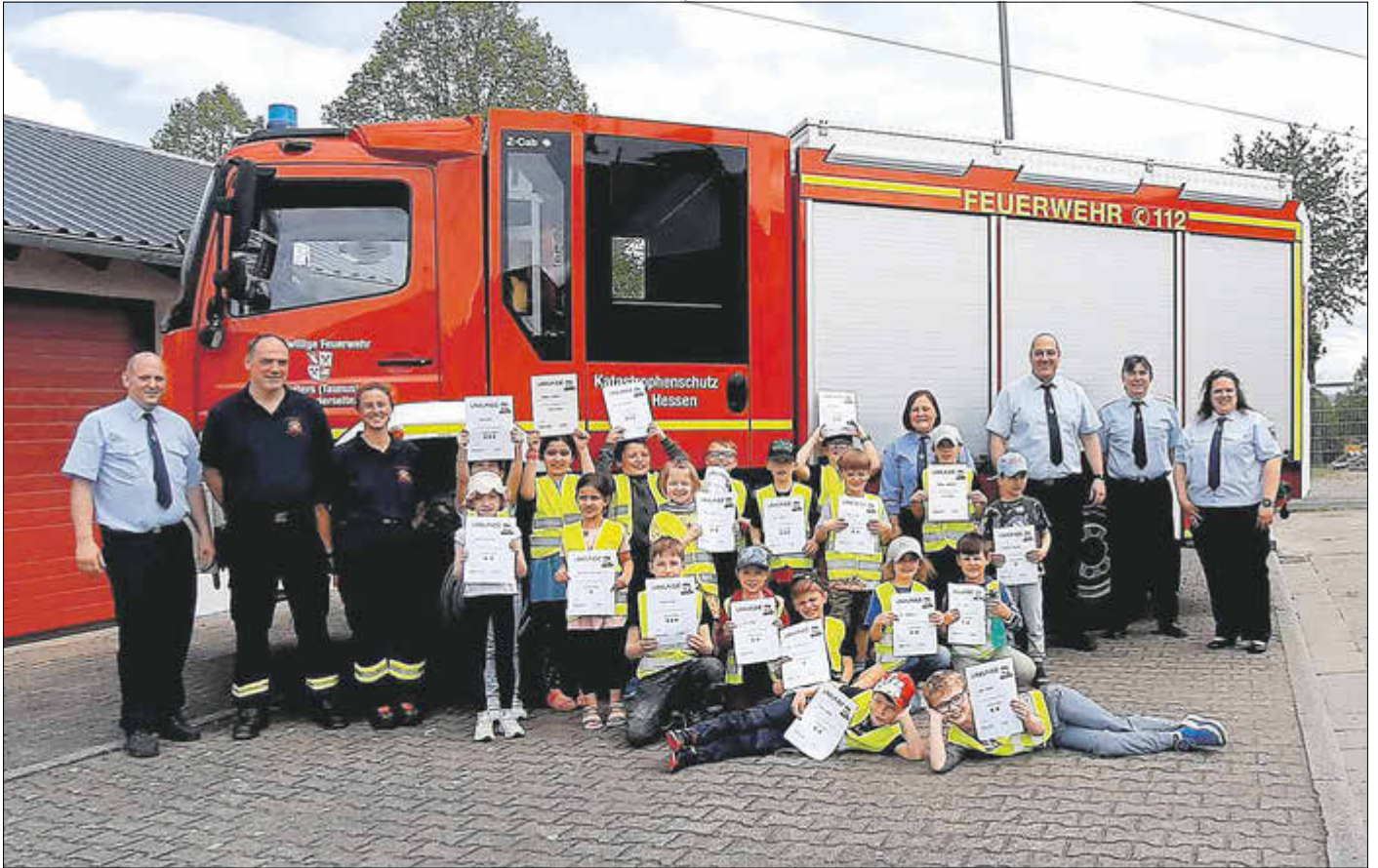
Die erfolgreichen Löschküken mit ihren Abzeichen