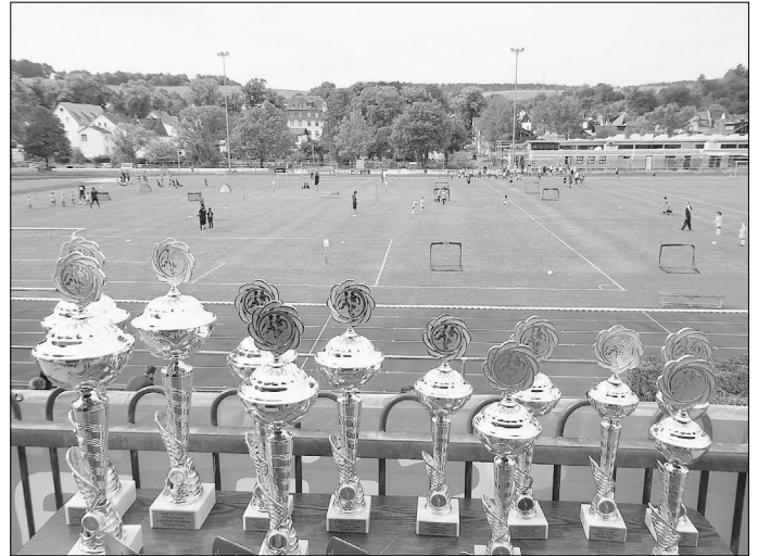
Funino Turnier der G-Junioren im letzten Jahr