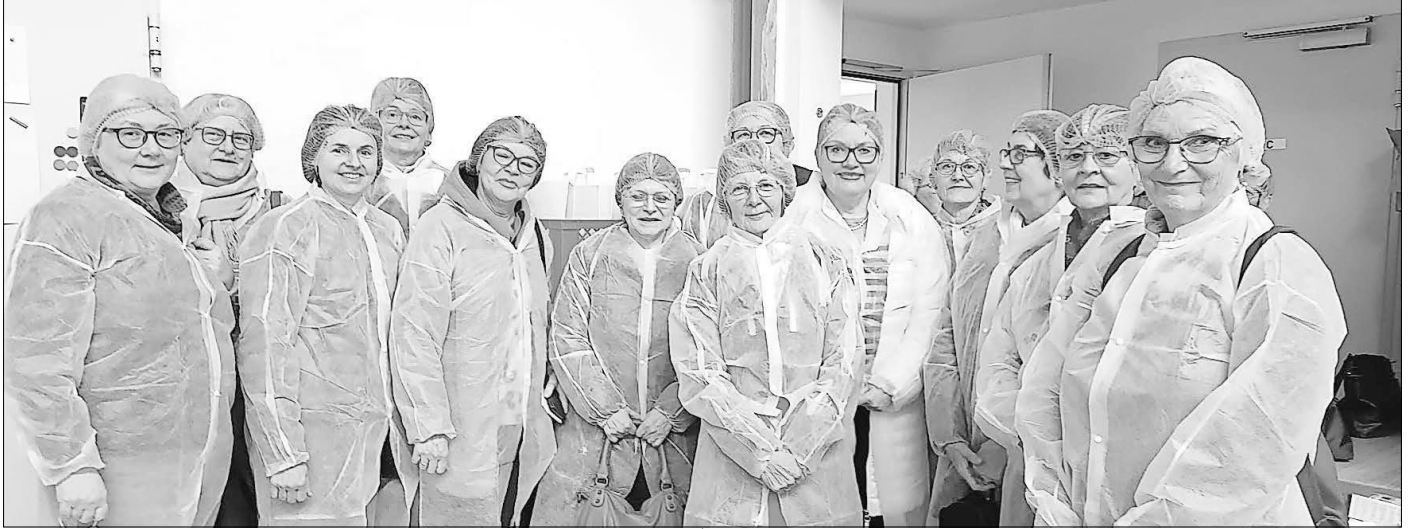
Der Frauenkreis beim Besuch von Deffland Backtechnik Oberweyer