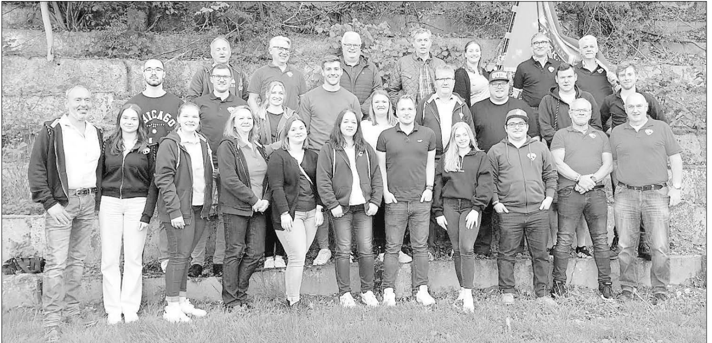
Eine starke Mannschaft mit dem Motto „Wir für unser Dorf“: Der neue Vorstand des Vereins Mir sein Seldersch, zusammen mit Jugendrat und Ältestenrat

Zum Abschluss der Jahreshauptversammlung und als Dank an alle Helfer, die dem Verein während des vergangenen Jahres tatkräftig zur Seite standen, gab es eine ordentliche Sause mit leckerem Essen & Getränken, Livemusik von der Band „Sauna Projekt“ und ganz viele tolle Gespräche.