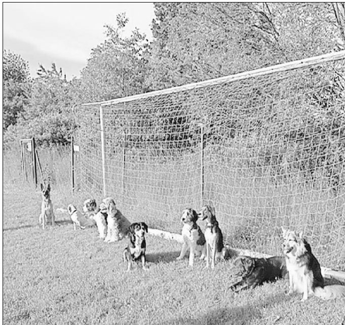
Entspannte Hunde nach der Vereinsstunde

Sportverein 1945 Münster e.V. Hundesportverein Taunushunde e.V. Selters