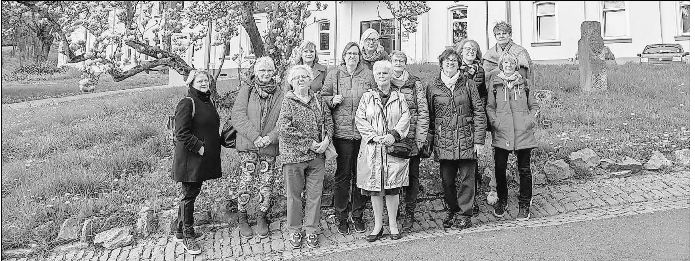
Der Frauenkreis beim Besuch der Gedenkstätte Hadamar im April

Anmeldungen gerne per Mail an frauenkreis-selters@gmx.de ; telefonisch unter Tel.-Nr. 06431-2833334 (Leipe) oder 1565 (Ensgraber).