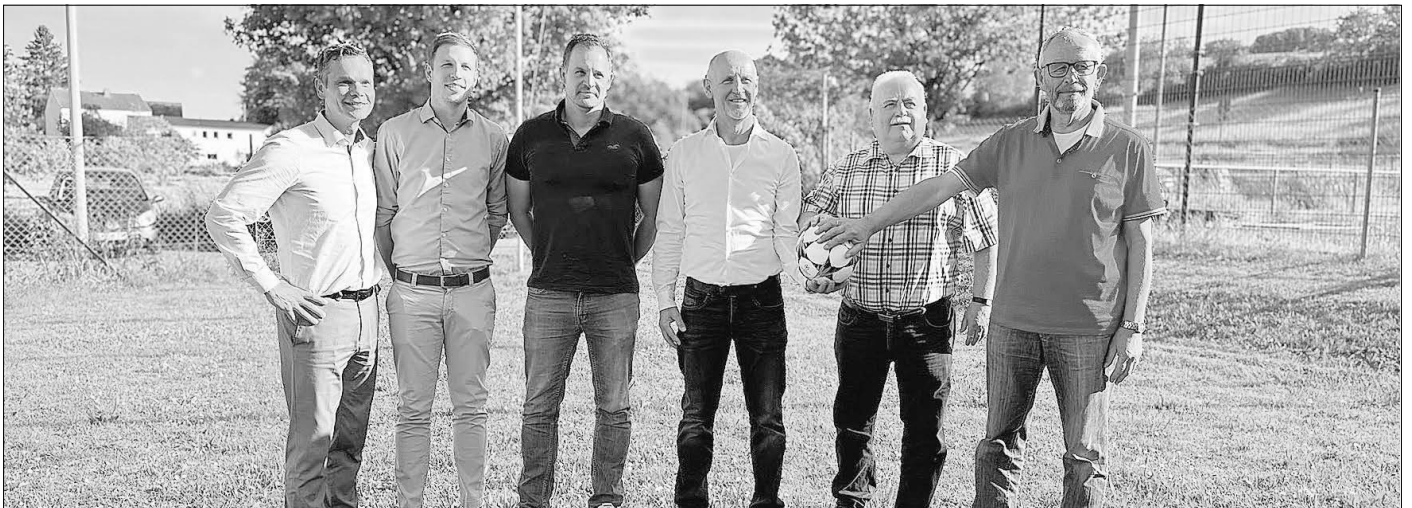
Das Bild zeigt jeweils den 1. und 2. Vorsitzenden des SVO, SVN und SVE.

Die neue SG wird mit zwei Mannschaften am Spielbetrieb teilnehmen, die 1. Mannschaft wird in der KOL Limburg-Weilburg spielen und die 2. Mannschaft in der A-Liga oder B-Liga (je nach Ausgang der Relegationsspiele des SV Erbach).