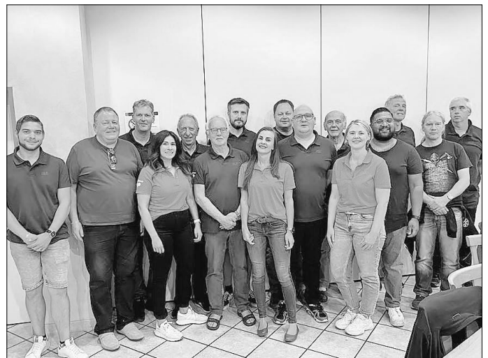
Der neue Vorstand des TTC Eisenbach

Weitere Inhalte der Versammlung waren die Aufnahme 12 neuer Mitglieder in den Verein, der sportliche Rückblick auf eine überaus erfolgreiche Saison mit guten Tabellenplatzierungen aller neun Mannschaften, die sehr hohe Trainingsbeteiligung auf hohem Niveau, das von durchschnittlich 20 Kindern besuchte Nachwuchstraining unter Leitung von engagierten Lizenztrainern und die Spielersitzung mit den Aufstellungen der Damenmannschaft, der vier Herrenteams sowie erfreulicherweise vier Nachwuchsmannschaften für die Saison 2023/24.