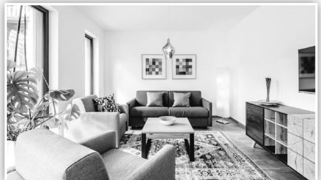
Hier lässt sich der Kurzurlaub im Ahrtal genießen.