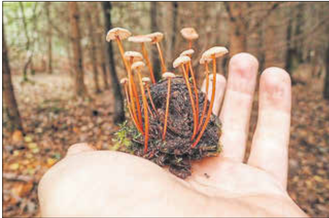
Echter Knoblauchschwinding ( Mycetinis scorodonius )