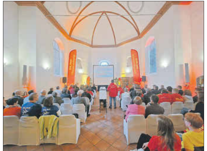
Das Kulturzentrum Alte Kirche war eine würdevoller Ort für das Jubiläum der DLRG

Danach waren alle zu einem gemütlichen Beisammensein eingeladen und konnten Bilder der letzten 50 Jahre anschauen.