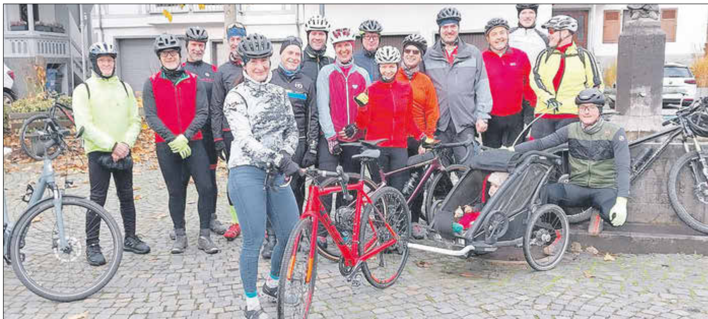
Das VLG Foto zeigt einen Teil der Gruppe am Klemens-Langenhof-Brunnen in Eisenbach