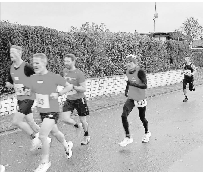
Das VLG Foto zeigt : VLG- und LSG Läufer bei der „Blockbildung“ ..