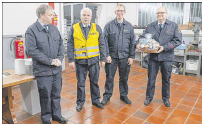
© Peter Ehrlich / Freiwillige Feuerwehr Niederselters