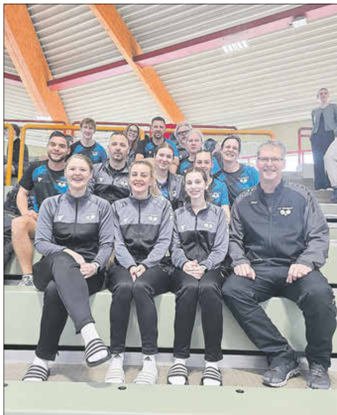
Unsere Starter(innen) bei der Bezirkspokalrunde