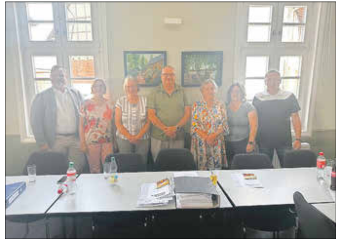
Neuer Vorstand des VdK Ortsverbands Selters-Münster

Die vorhandene Liste mit den für die ausgeschriebenen Funktionen jeweils einzeln besetzten Bewerbern wurde per Akklamation von den Mitgliedern jeweils einstimmig bestätigt, so dass sich der neue Vorstand des VdK Ortsverbands Selters-Münster wie folgt präsentiert (von links nach rechts):