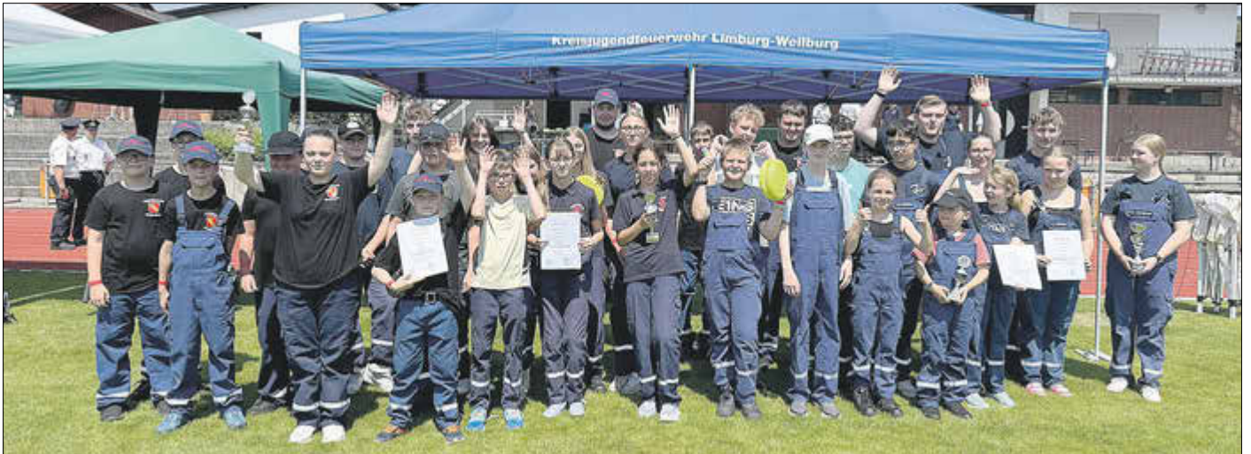
Die teilnehmenden Jugendfeuerwehren der Ortsteile der Gemeinde Selters.

Ein gelungener Tag für die Jugendfeuerwehren, bei dem Teamgeist, Einsatzbereitschaft und Spaß im Mittelpunkt standen.