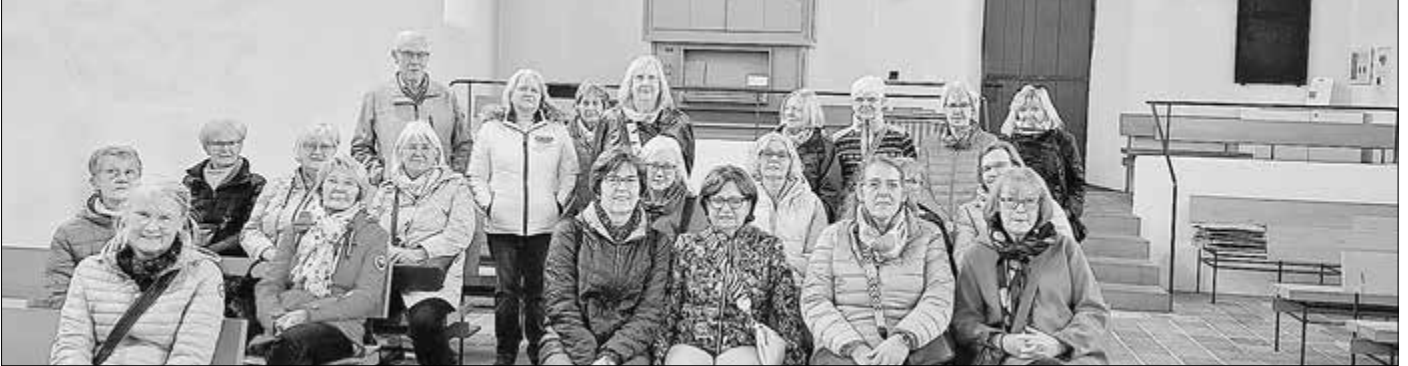
Das Foto zeigt den Frauenkreis bei einem Besuch der Jesus-Bruderschaft in Gnadenenthal.

Anmeldungen per Mail an frauenkreis-selters@gmx.de oder telefonisch unter der Tel.-Nr. 1565 (Ch. Ensgraber).